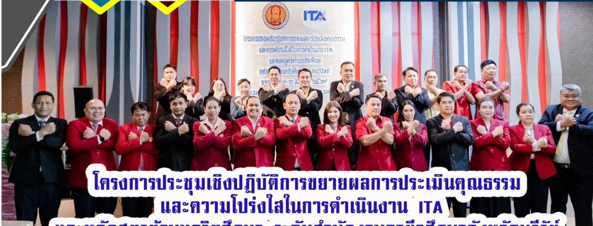
โครงการประชุมเชิงปฏิบัติการขยายผลการประเมินคุณธรรม และความโปร่งใสในการดำเนินงาน ITA และหลักสูตรด้านทฤษฎีศึกษา ระดับสำนักงานอาชีวศึกษาจังหวัดบุรีรัมย์